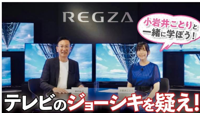
第1シリーズ：「テレビのジョーシキを疑え！」