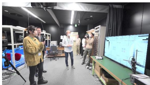
#1：永山研究開発センター紹介（1）

レグザチャンネルURL: https://www.youtube.com/user/REGZAchannel