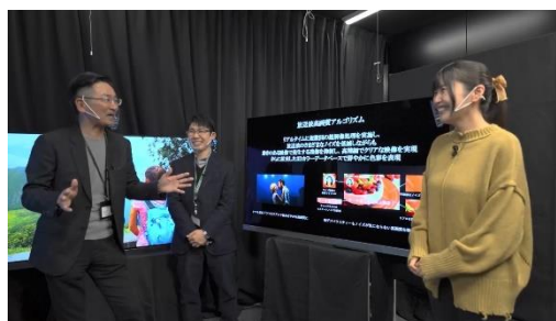
#3：新高画質映像処理エンジン紹介