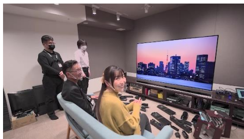
#2：永山研究開発センター紹介（2）